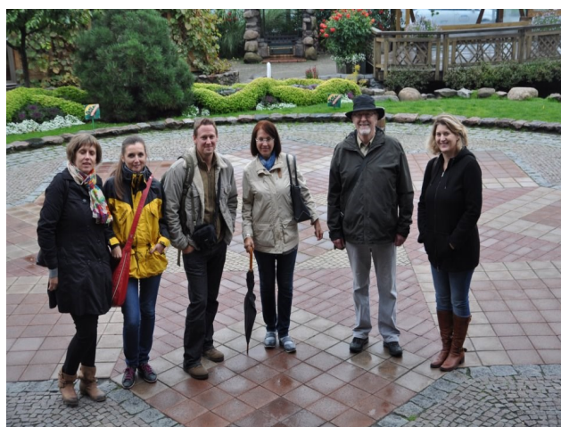
Profesori—suradnici na Comenius projektu

Posljednji dan imali smo organiziran izlet na Baltičko more.