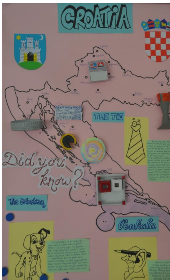
Plakat koji je predstavio Hrvatsku

Učenici su također napravili plakat koji prati prezentaciju spomenutih objekata, tako što se na njega lijepe makete. To je bila vrlo lijepa, atraktivna vizualna potpora prezentaciji koja je rezultirala kartom Hrvatske prekrivenom prekrasnim znamenitostima. Još jedna prezentacija predstavila je našu školu i dala osnovne podatke o njoj.